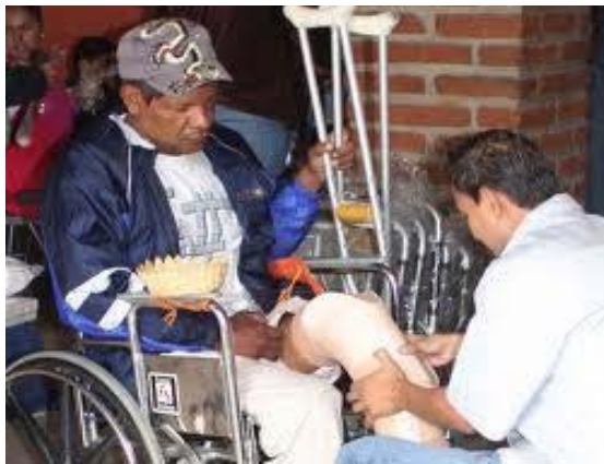
El IMSS realizará la semana de la discapacidad.