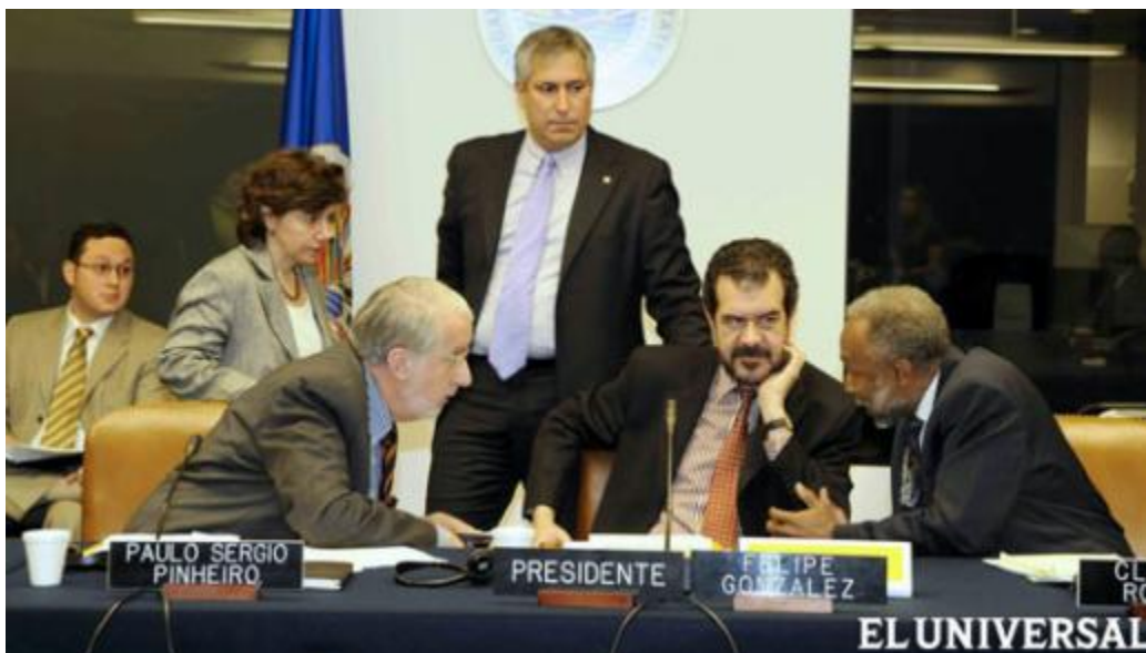
Los miembros de la CIDH preocupados por obstáculos a ONG

Alerta que el texto tiene artículos que atentan contra el derecho a asociarse